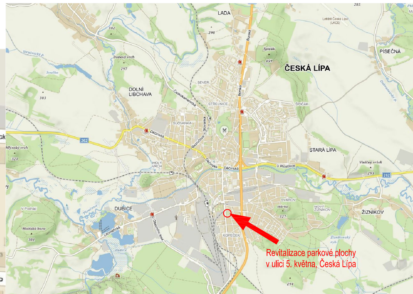
Revitalizace parkové plochy v ulici 5. května, Česká Lípa