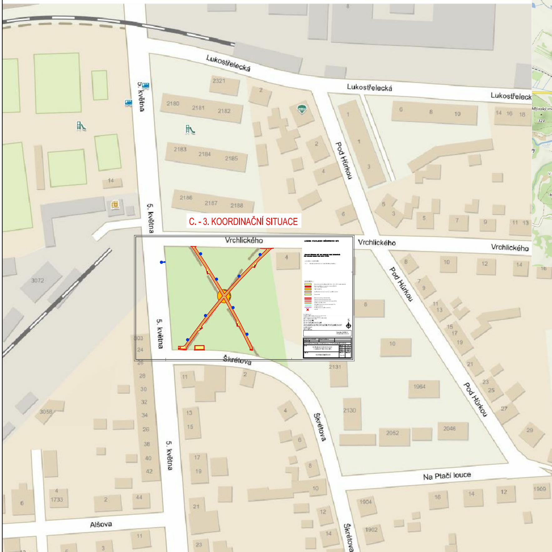
C. - 3. KOORDINAČNÍ SITUACE